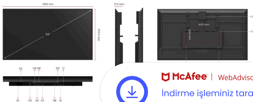
1. Power Switch

43-inç ile 98-inç arasında değişen 6 boyutta sunulan ve papatya dizimi uyumluluğuyla tamamlanan CDE30 Serisi, herhangi bir kampüs veya kurumsal alanın iletişim gereksinimlerini fazlasıyla karşılar.